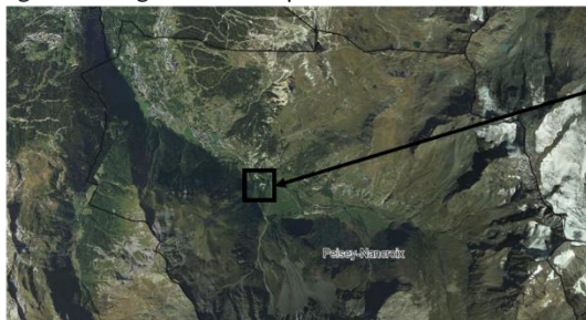
Commune de Peisey-Nancroix